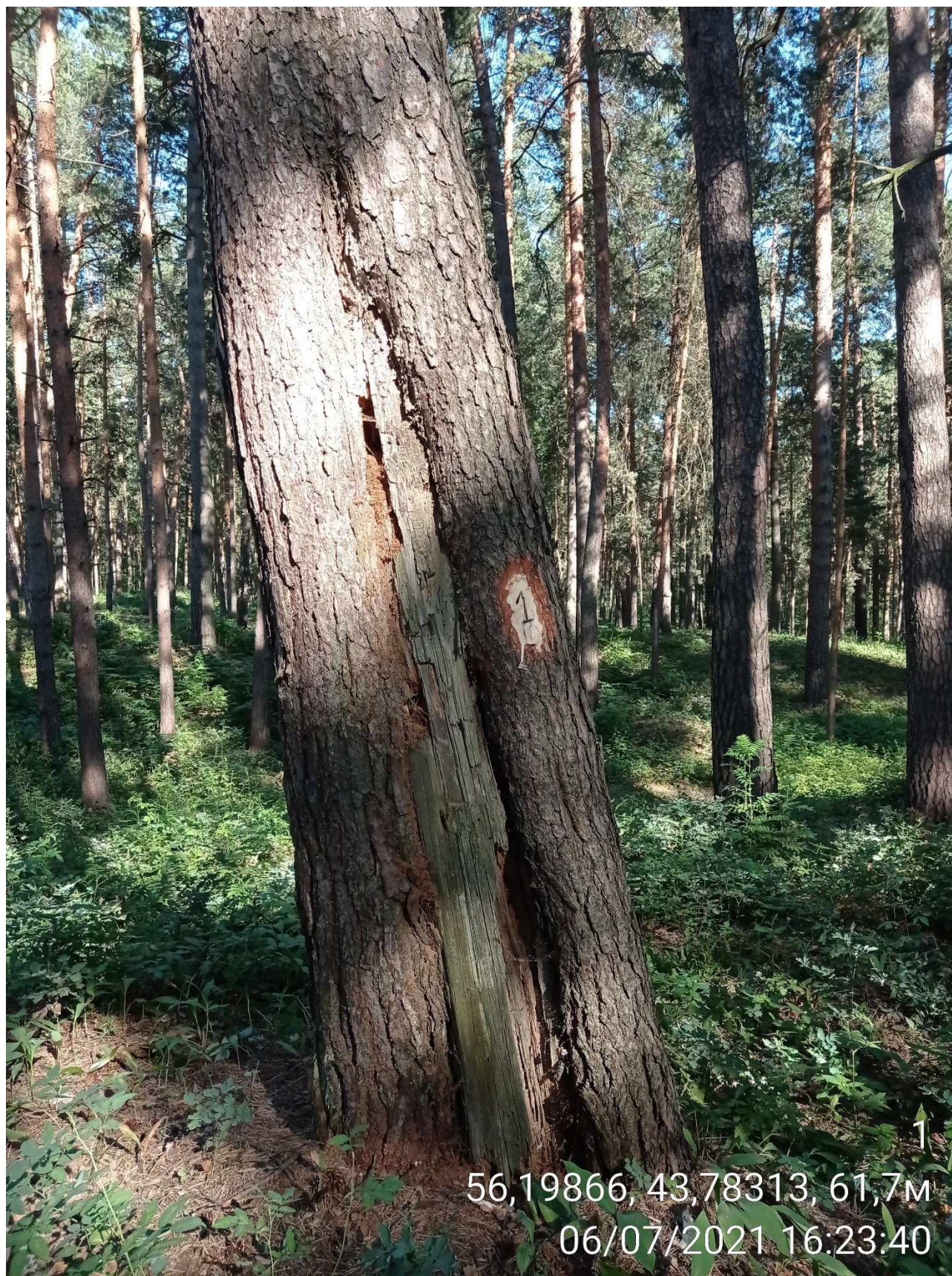
Дерево № 1 (Стволовая гниль)